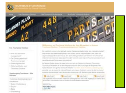
Skyscraper (120x600 Pixel)