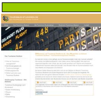
Leaderboard (728x90 Pixel)

Werben Sie noch mit hohen Streuverlusten auf allgemeinen Studienportalen? Wenn Sie sich für www.Tourismus-Studieren.de entscheiden, erreichen Sie Ihre Zielgruppe nahezu ohne Streuverluste. Die Zielgruppe von www.Tourismus-Studieren.de ist auch Ihre Zielgruppe - machen Sie sie durch Bannerwerbung auf Ihr Studienangebot aufmerksam.