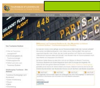
Full Banner (468x60 Pixel)